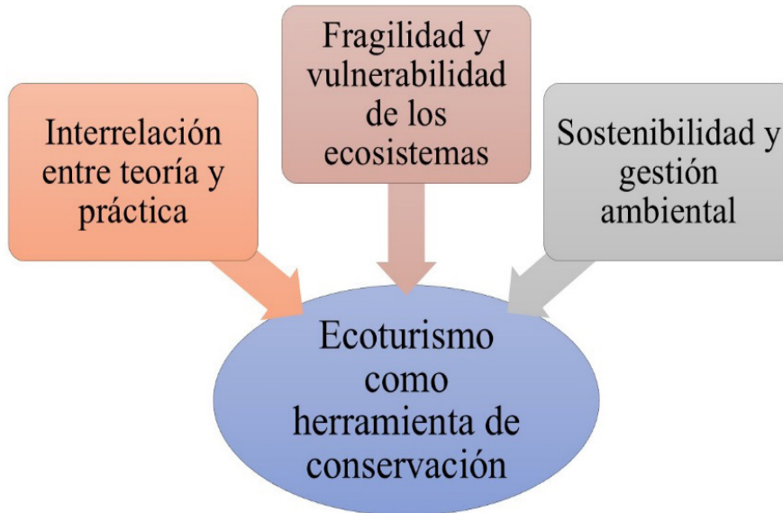
Figura 1. Ecoturismo y conservación

El análisis revela una tensión irresoluble entre los principios teóricos del ecoturismo y su implementación práctica. Los datos demuestran que gran parte de los casos estudiados presentan algún grado de alteración ecológica, incluso en proyectos certificados como sostenibles. (18) Las áreas más afectadas son los corredores biológicos y las zonas de amortiguamiento, donde la construcción de senderos y miradores ha modificado patrones de migración animal en al menos 12 de los 20 casos analizados. Estos cambios no se limitan a la fauna carismática; los invertebrados y el microbiota del suelo muestran alteraciones significativas en áreas con más de cinco años de actividad turística continua. (19) La figura 1 expone tres elementos que determinan el porqué el ecoturismo se concibe también como una herramienta que favorece la conservación ambiental.